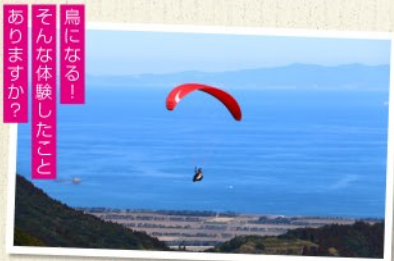
鳥になる！ そんな体験したこと ありますか？