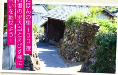
石垣の里 100選 思いを馳せよう！

場所：笠沙町片浦 14847-1 期間：通年 時間：所要1時間～2時間 人数：1名～ 料金(お一人様)：レンタル釣竿2時間¥500 えさ代¥300 お問合せ：笠沙恵比寿 0993-59-5020