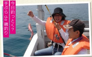
手ぶら釣りに 今日釣っちゃ 手ぶら釣りに