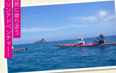
自然に寄り添って マリナドベンチャー！

場所：笠沙町 / 大浦町 / 金峰町 期間：通年 時間：所要1時間～ 人数：- 料金(お一人様)：無料 お問合せ：南さつま市観光協会 0993-53-3751