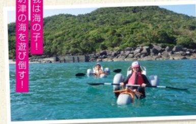
我は海の子！ 坊津の海を遊び倒す！

場所：笠沙町片浦 7670-4 期間：通年 時間：所要約50分 人数：- 料金(お一人様)：無料 お問合せ：南さつま市観光協会 0993-53-3751