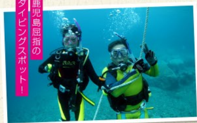
鹿児島屈指の ダイビングスポット！

場所：大浦町亀ヶ丘 期間：晴天時のみ 時間：9:00～15:00/ 所要確認 (天候、風向きにより変動) 人数：1名～10名 料金(お一人様)：年齢×¥100 お問合せ：TEAM GAMELLA 090-8399-2320