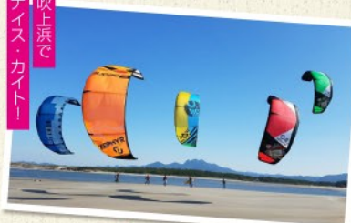
吹上浜で ナイス・カイト！

場所：笠沙町片浦 5653-1 / 坊津町坊 9321-25 期間：通年(4～11月がおすすめ) 時間：半日～ 人数：4名まで 料金(お一人様)：¥15,000 お問合せ：ラ・ボンバ 099-284-0639 ダイビングステーション海来館 0993-63-0141