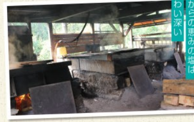
海からの恵みの塩は、味わい深い