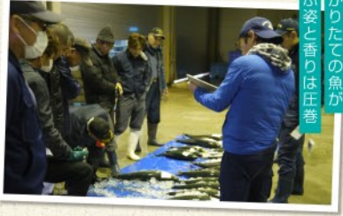
塩がらたての魚が、塩の姿と香りは匠の技