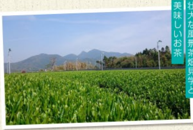
壮大な風景茶畑見学と美味しいお茶