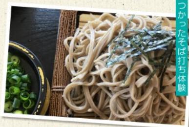
地元特産のそば粉をつかったそば打ち体験