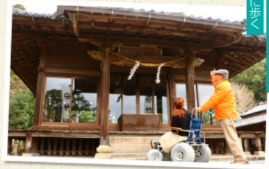
歴史を刻んだ道を共に歩こう