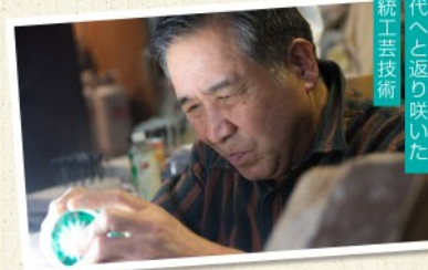
現代へと振り返った伝統工芸技術