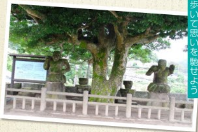
歴史深い場所を見て歩いて思いを馳せよう