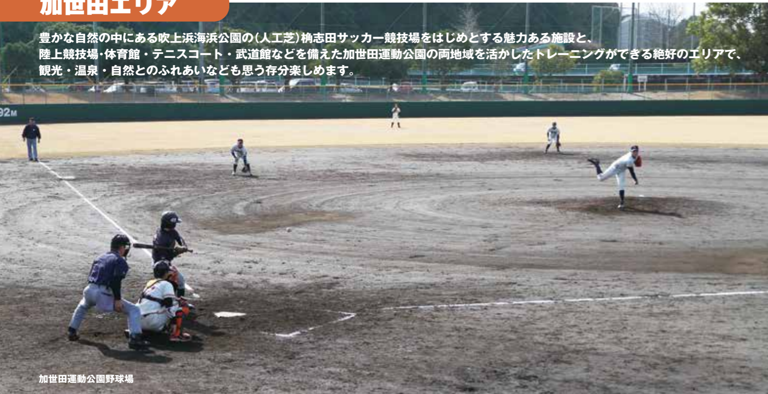
加世田運動公園野球場

豊かな自然の中にある吹上浜海浜公園の(人工芝)楠志田サッカー競技場をはじめとする魅力ある施設と、陸上競技場・体育館・テニスコート・武道館などを備えた加世田運動公園の両地域を活かしたトレーニングができる絶好のエリアで、観光・温泉・自然とのふれあいなども思う存分楽しめます。