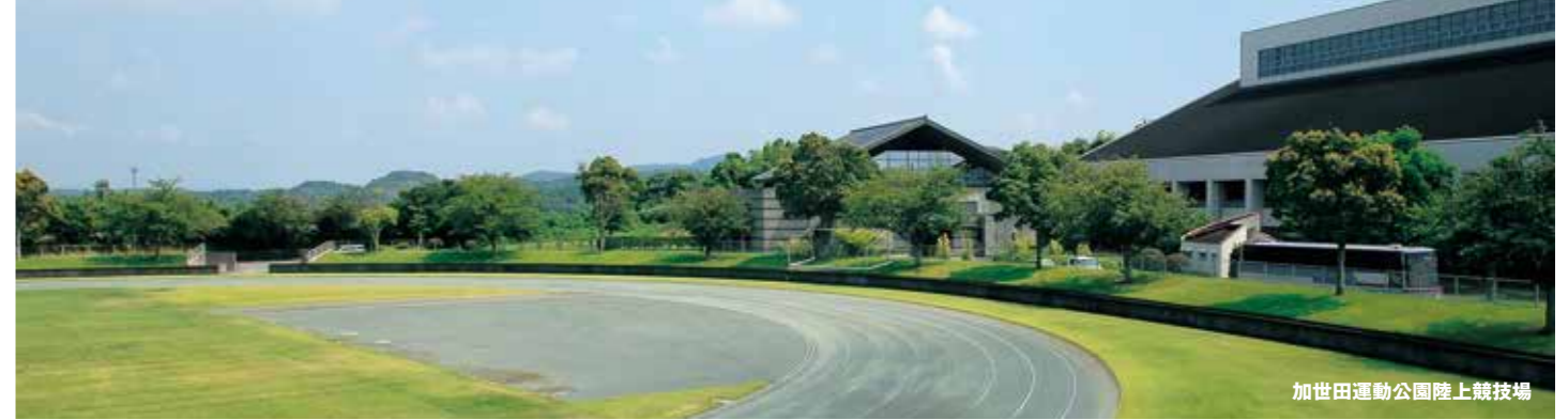
加世田運動公園陸上競技場