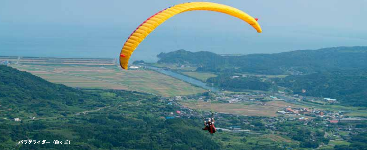
パラグライダー（亀ヶ丘）

南さつま市の中央に位置し広大な干拓地を擁するこのエリアは、 なだらかな傾斜地からのパラグライダーや、サイクリングのトレーニングなどに適したコースや、 アリーナ・テニスコートを有する総合グラウンドがあります。