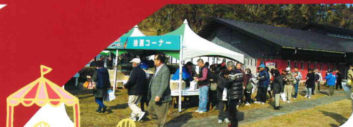
写真は以前のイベント風景です。

会場ではキッチンカーや南さつまの物産の販売などで、みなさまのご来場をお待ちしています。