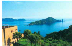
眼前の笠沙美術館からの眺め